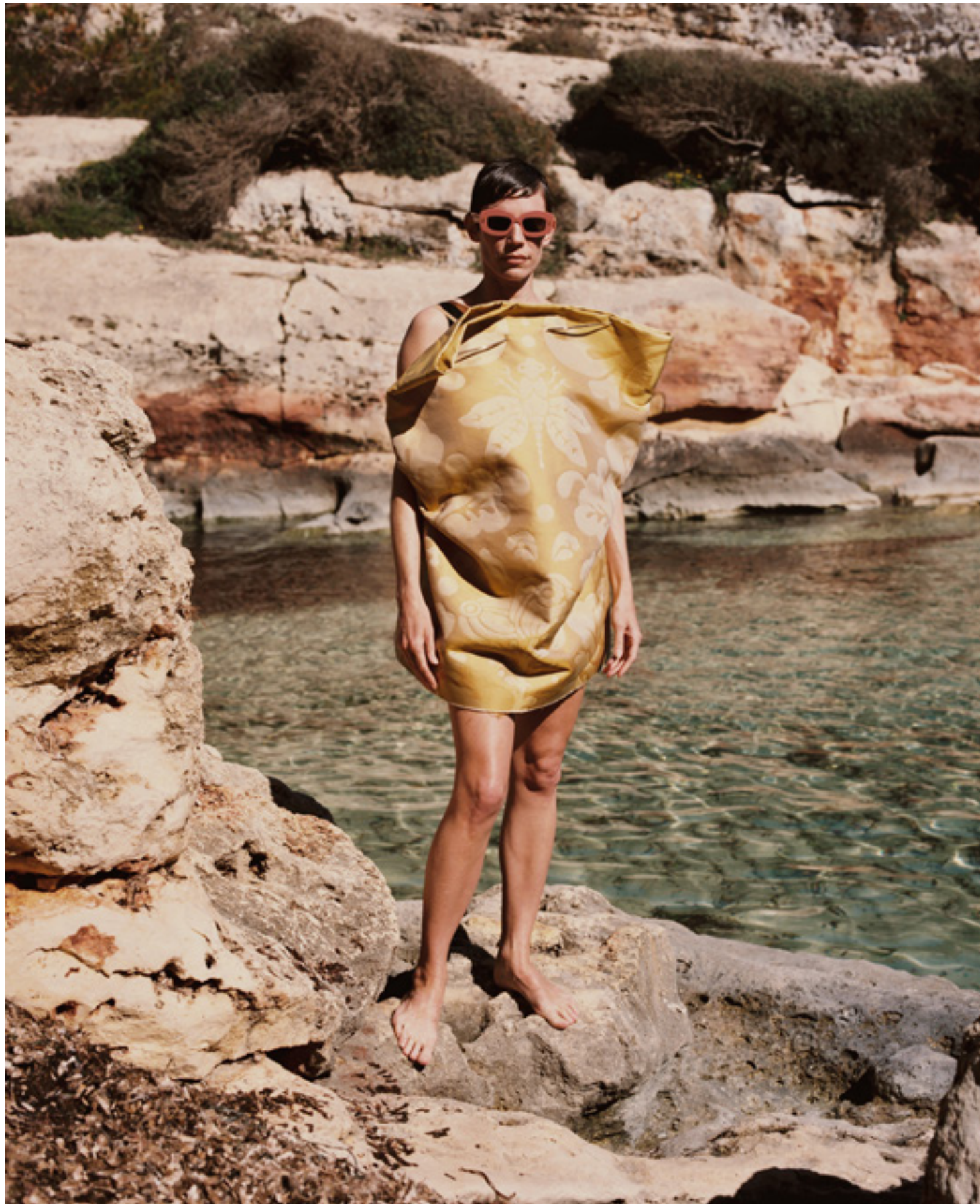
Robe et lunettes de soleil, LOEWE. Page de droite : Maillot de bain en velours, VÉRONIQUE LEROY. Boucle d'oreille, MARION VIDAL. Bague, LA MANSO.