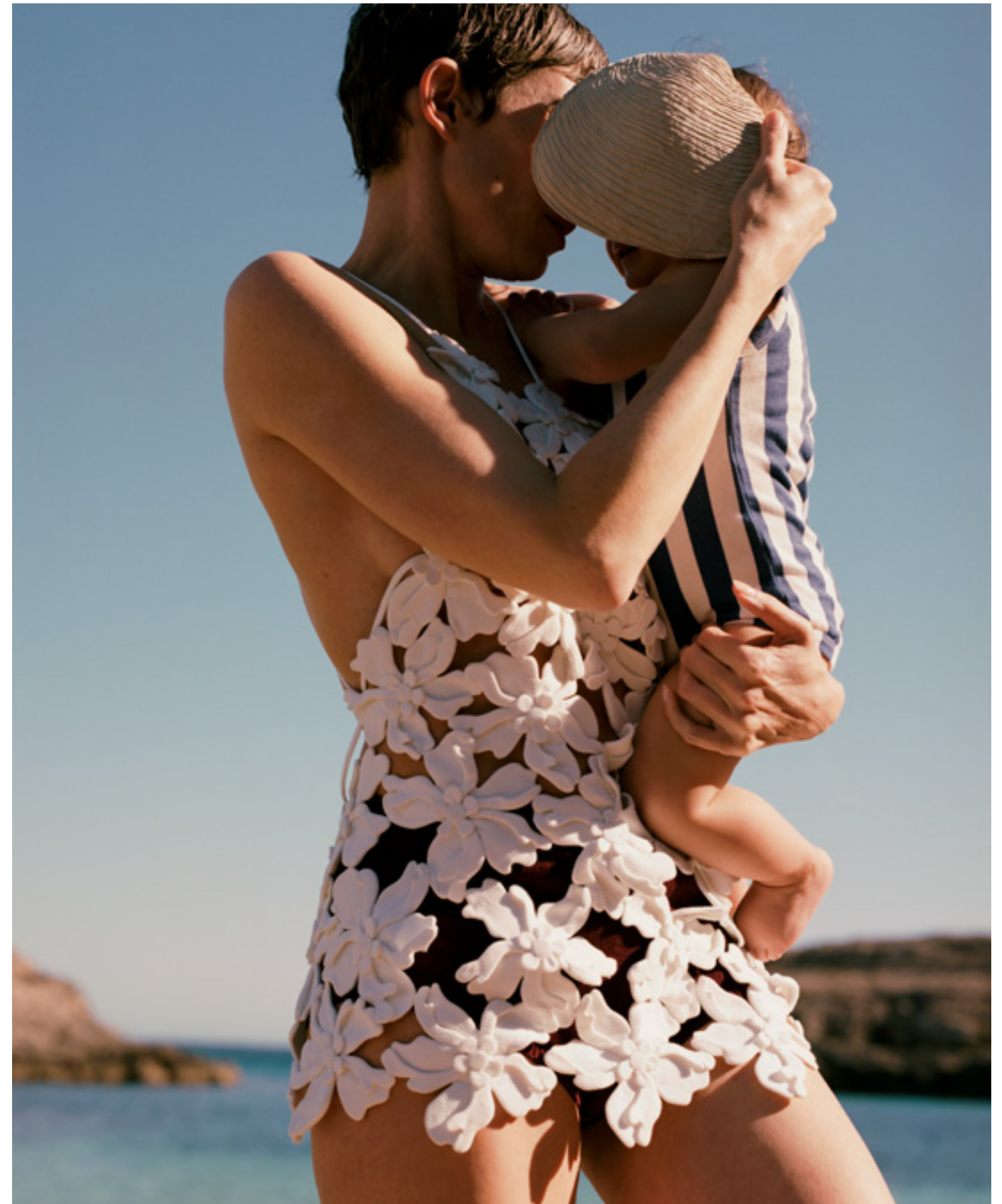
Robe, VALENTINO. Body à rayures, WE ARE KIDS. Coquillage, JULIETTE DE CADOUAL.