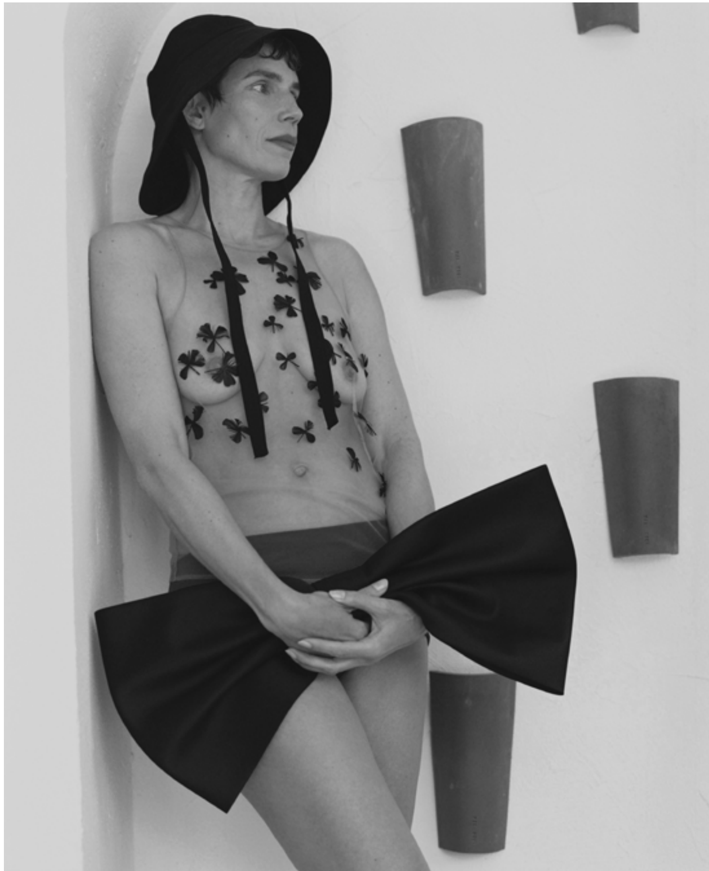
Top transparent, MEYER. Shorty, HERMÈS. Bob, SOEUR. Nœud, DICE KAYEK.