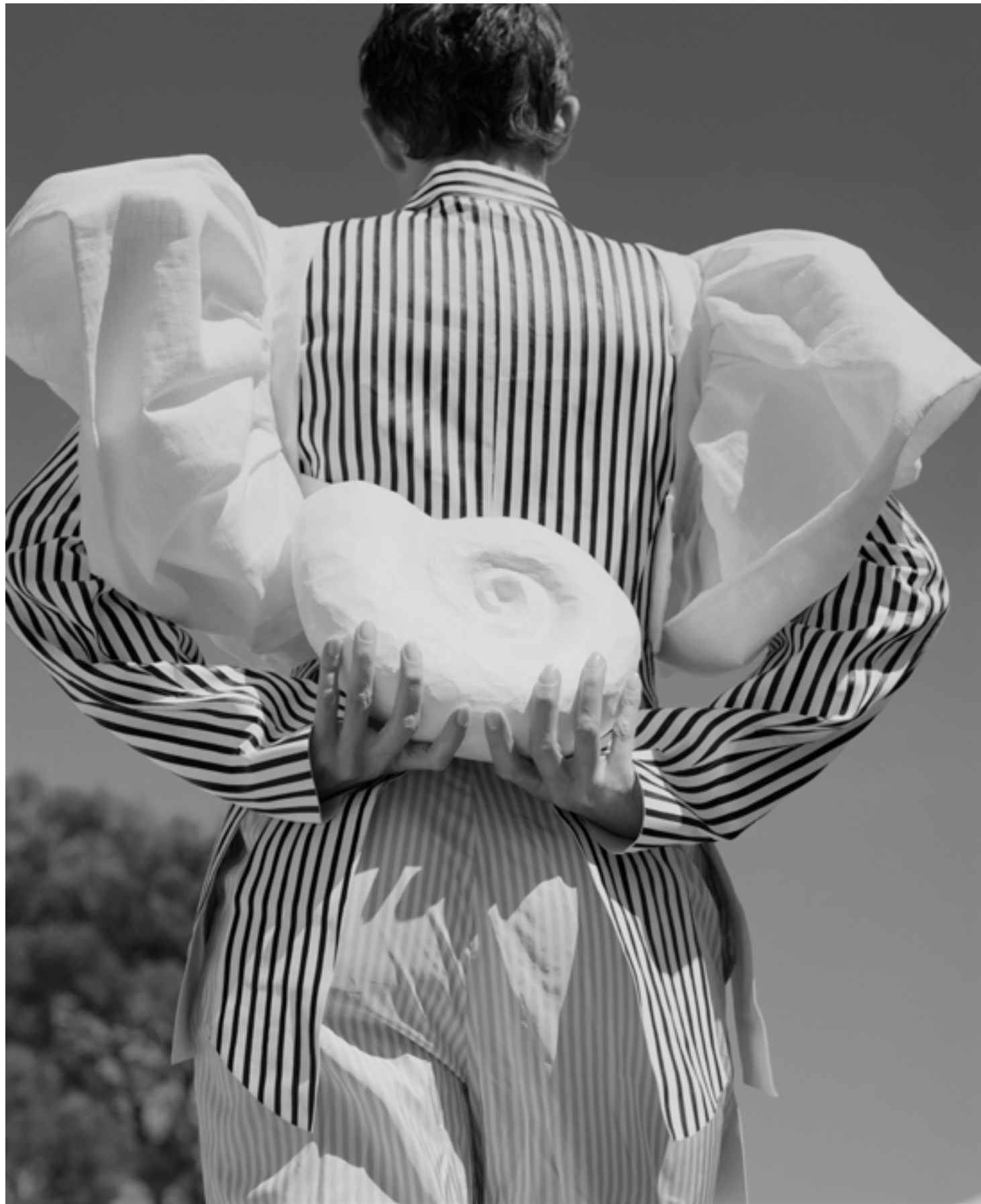
Costume à rayures, LOUIS VUITTON. Blouse, NICKLAS SKOVGAARD C/O SSENSE. Coquillage, JULIETTE DE CADOU DAL.