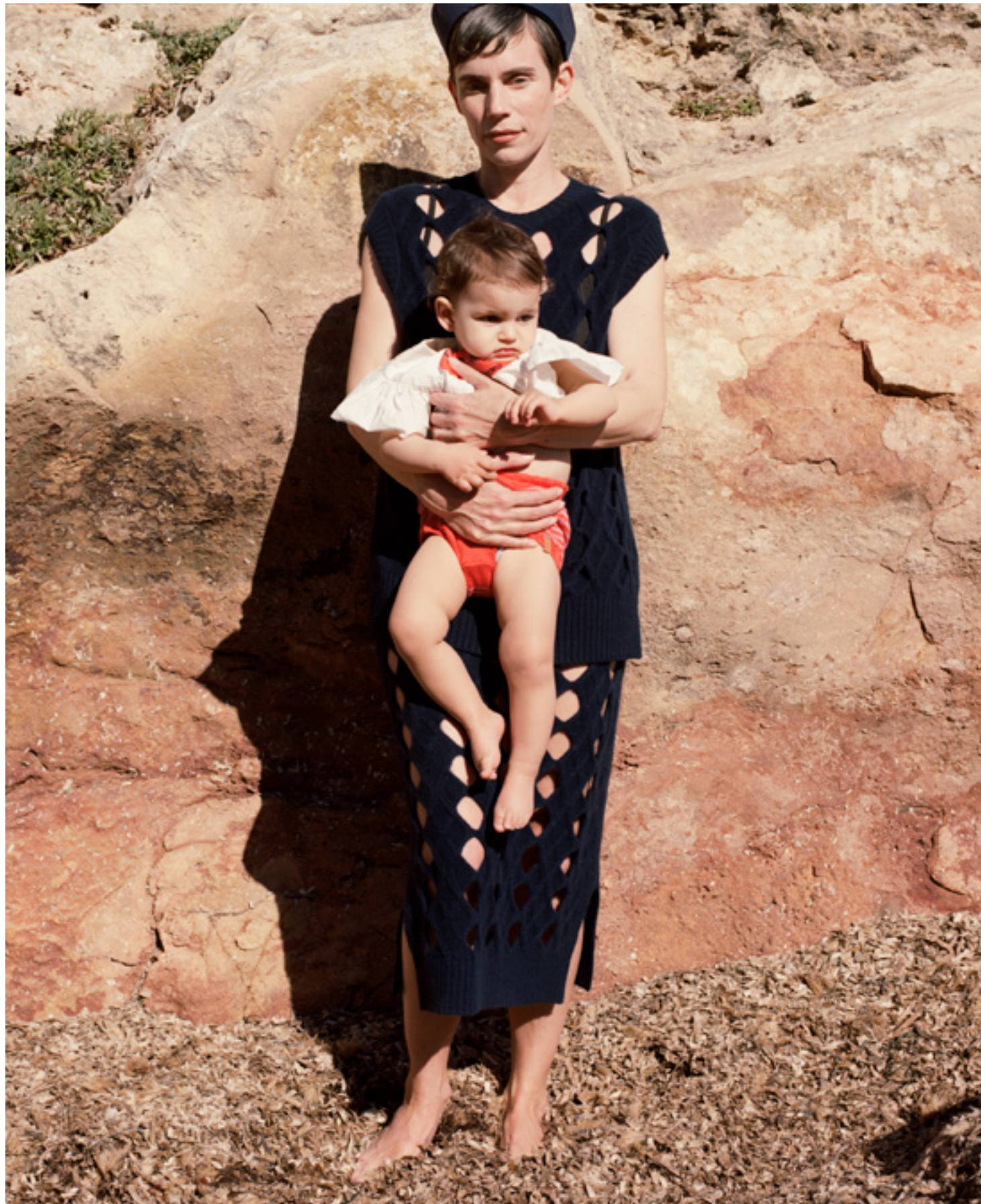
Pull et jupe en maille, BOMPARD. Calot, SURPLUS DOUSSOUX. Collerette, THE ANIMALS OBSERVATORY. Bloomer, PIUPIUCHICK. Page de droite : Costume à rayures, LOUIS VUITTON. Chaussures, DRIES VAN NOTEN.